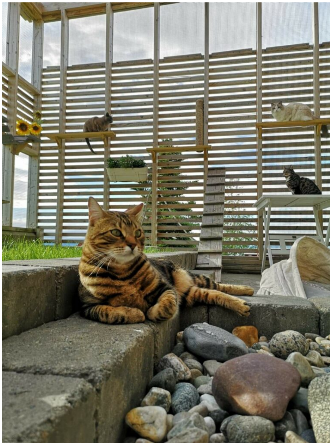
Flere katter slapper av ute i fellesrommet.

– Vi er opptatt av at det ikke bare skal være trygt for katter, men også trygt for eieren. Selv om eierne reiser, så er de veldig engasjerte og ofte bekymret for kattene sine. Det syns vi er veldig flott å se, sier Hjulstad-Hoff.